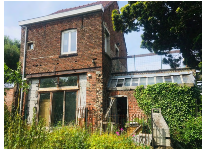
GARAGES ET APPARTEMENT JARDIN