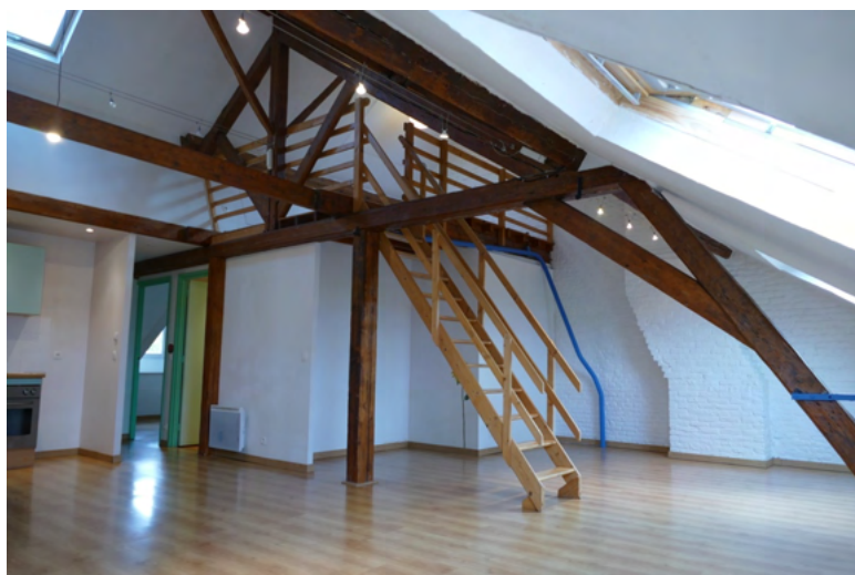
SALON APPARTEMENT 6