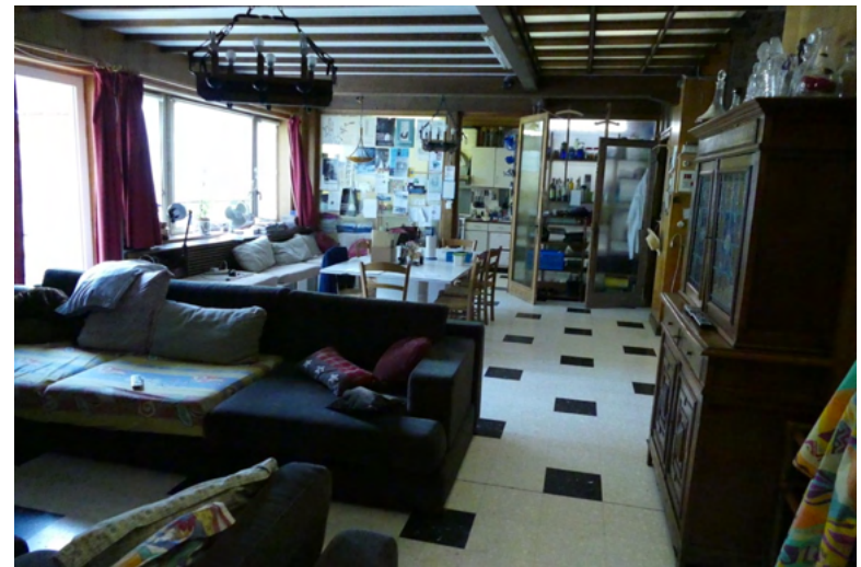
SALON VERANDA MAISON