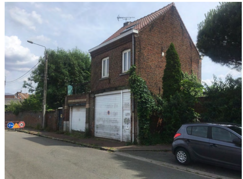
GARAGES ET APPARTEMENT JARDIN