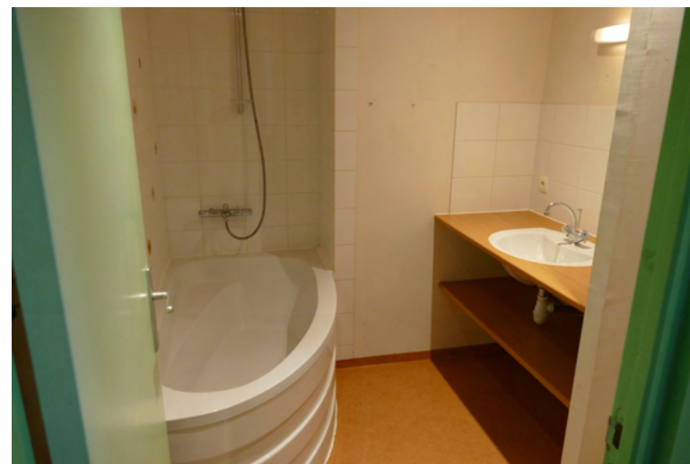
SALLE DE BAIN APPARTEMENT 6