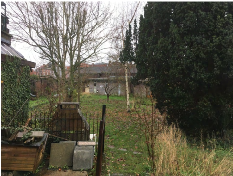
LE DOJO AU FOND DU JARDIN