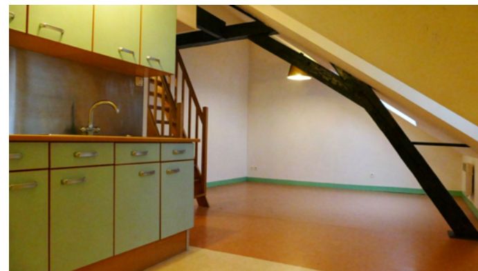
SALON CUISINE APPARTEMENT 4

Chauffage électrique individuel / Eau chaude par cumulus