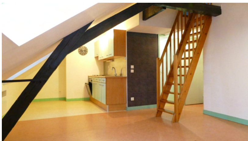
SALON CUISINE APPARTEMENT 3