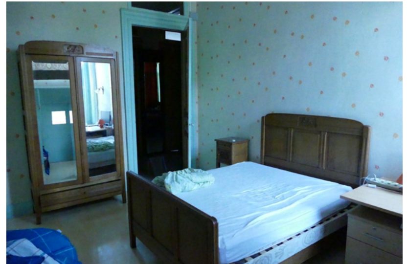
CHAMBRE ETAGE MAISON