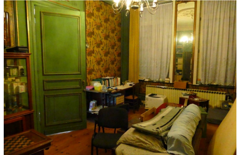
CABINET MEDICAL MAISON