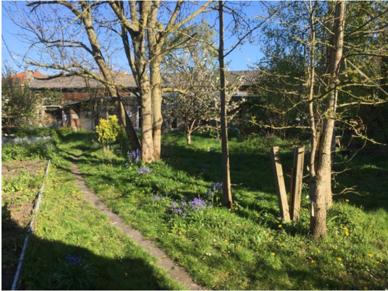
VUE SUR LE FOND DU JARDIN