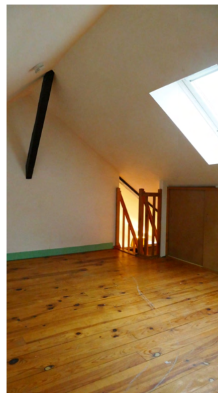
MEZZANINE APPARTEMENT 4