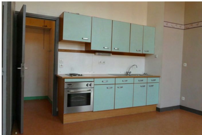
CUISINE APPARTEMENT 3