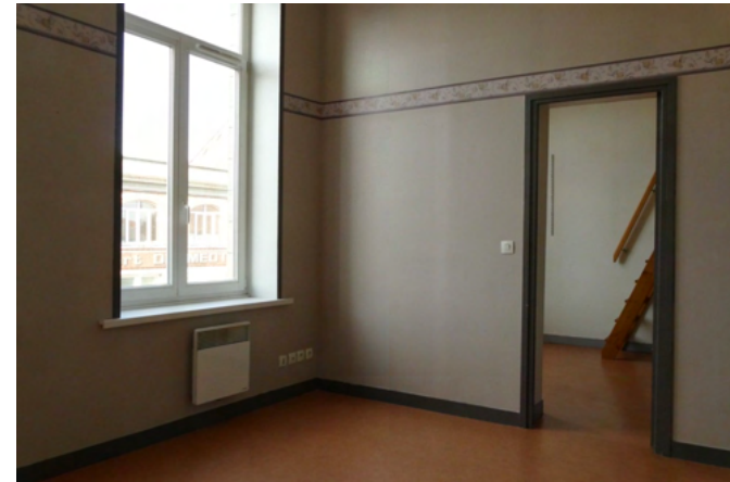
SALON APPARTEMNET 3