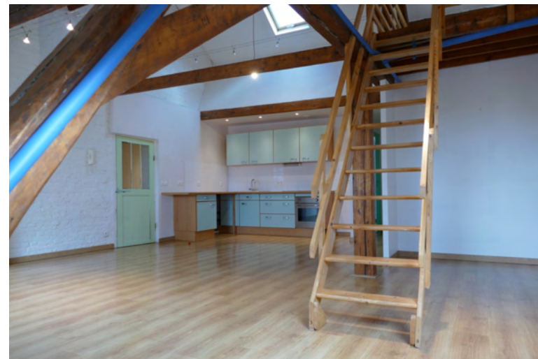
SALON CUISINE APPARTEMENT 6

Chauffage électrique individuel / Eau chaude par cumulus