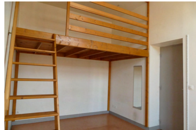
CHAMBRE APPARTEMENT 3