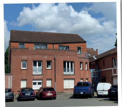
Pendant 42 ans, le bâtiment a accueilli une résidence de l'association Les Papillons Blancs de Lille. Il fait l'objet d'une rénovation intérieure complète.