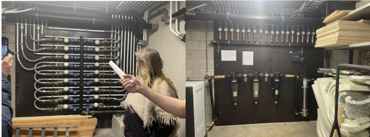
système permettant la récupération de l'eau de pluie

Toutes les toitures au sud sont couvertes de panneaux photovoltaïques et celles situées au nord sont végétalisées.